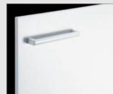
□ VP1 ホワイト