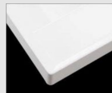
□ H プレーンホワイト