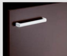
□ VR1 ブラウン