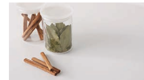
人造大理石トップ

インテリアに合わせてカラーコーディネート。耐久性にも優れた人造大理石トップです。