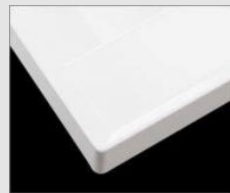
□ H プレーンホワイト