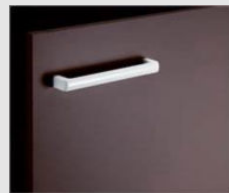
□ VR1 ブラウン