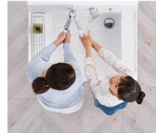
2人並んでの身支度もスムーズ