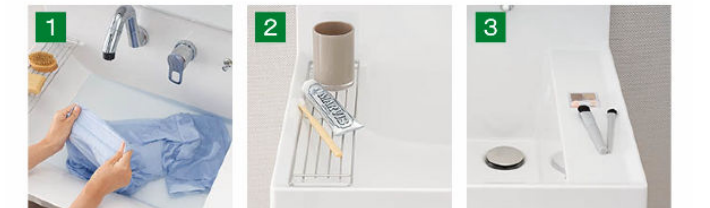
バケツの水汲みや衣類のつけ置き洗いもしやすいです。 コップや泡立てネットなど、濡らしたくないものを、一つ置き洗いをしやすくなります。