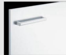
□ VP1 ホワイト