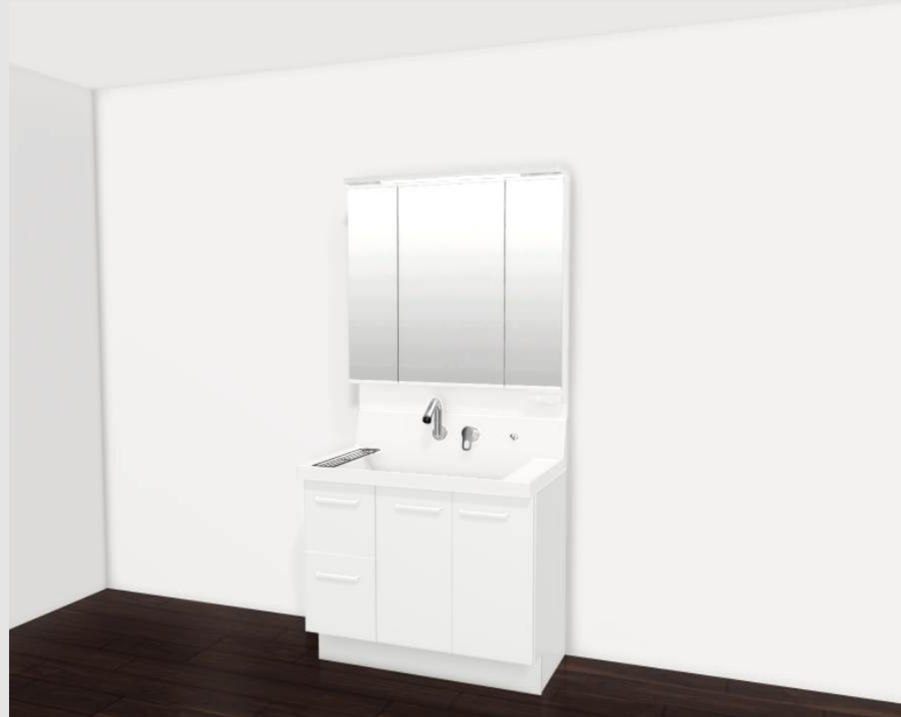
CG合成によるイメージ画像です。