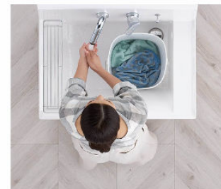
つけ置き洗い中も、バケツを避けての手洗いもOK