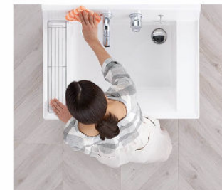
汚れにくくお掃除もカンタン