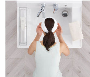
洗顔・洗髪もゆったりスペースで